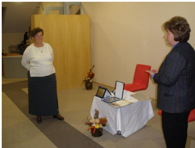
Razgovor prije promocije.

Priloge o našoj djelatnosti objavljivali smo u tisku i elektronskim medijima. Na poziv Radio Daruvara, sudjelovali smo u emisijama koje su posvećene knjižnici kao informacijskom središtu. Hrvatska televizija u emisiji Prizma imala je također priloge o radu Središnje knjižnice za češku manjinu.