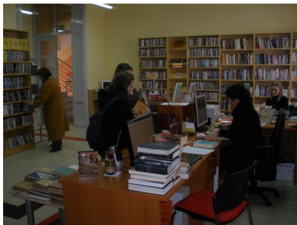
Jedan od najposjećenijih odjela Knjižnice.

Najčešće se posuđuje beletristika i publicistika, no na Odjelu se još osim posudbe knjižne građe odvijaju i sljedeći poslovi: učlanjivanje korisnika knjižnice, pružanje informacija o građi u knjižnici, fotokopiranje građe, obavljanje međuknjižnične posudbe, upućivanje i obučavanje u samostalnom pronalaženju građe, posudba i neknjižne građe, omogućavanje korištenja zavičajnom i zaštićenom zbirkom, omogućavanje čitanja tiska i drugih stručnih periodičkih publikacija, edukacija korisnika za samostalnu upotrebu Internet kioska, omogućavanje samostalne upotrebe računala za vlastite potrebe, pisanje opomena dužnicima, računalna obrada knjižne i neknjižne građe, selekcija, pročišćavanje i vrjednovanje fonda, inventarizacija, signiranje, katalogizacija, klasifikacija i tehnička obrada građe, vođenje kartoteke rezervacija, zaštita građe, vođenje brige o svakodnevnom smještaju građe na policama, čuvanje, odlaganje i pohranjivanje novina i časopisa, vođenje blagajne, vođenje dnevne, mjesečne i godišnje statistike, vršenje permanentnog otpisa amortizirane građe, savjetodavno sudjelovanje pri nabavljanju građe, kontinuirana priprema izložaba postavljenih u predvorju Knjižnice, priprema radio emisije Knjigovežnica, priprema književnih večeri, tribina, predavanja i sl.